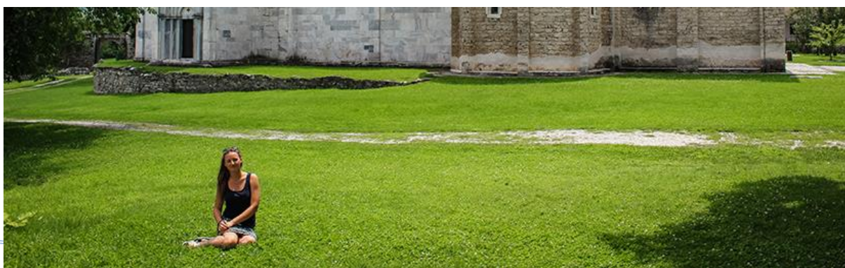
Бела Црква – Блажево Јул, 2018.