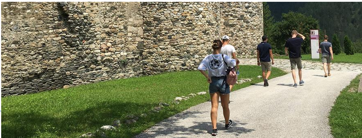
Бела Црква – Блажево Јул, 2018.