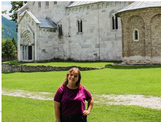
Бела Црква – Блажево Јул, 2018.