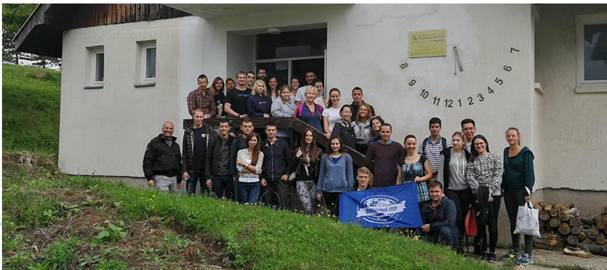
Бела Црква – Блажево Јул, 2018.

У непосредној близини Краљева, смештена је Студеница, један од највећих и најбогатијих српских манастира који је током своје историје одолео честим нападима Турака, земљотресу и пожару. Сматра се да је манастир Студеница убедљиво најлепши од свих српских манастира и из тог разлога је понео назив Мајка свих светиња. Уз пратњу водича, обилазимо читав комплекс манастира, а затим пут настављамо према Краљеву. Када од Краљева пођете према Матарушкој бањи наићи ћете на Жичу. Препознатљива је по црвеној фасади и нетакнутој природи. Тихим и умилим гласом љубазна монахиња нам говори о историјату манастира, а гостима из Русије је припремила краћи документарни филм како би се на очигледан начин што боље упознали са његовом прошлошћу. У близини манастира правимо паузу за ручак, а након тога застајемо на Руднику и путем преко Тополе, стижемо у Београд.