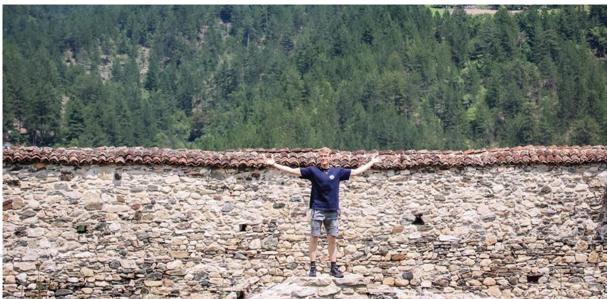
Бела Црква – Блажево Јул, 2018.